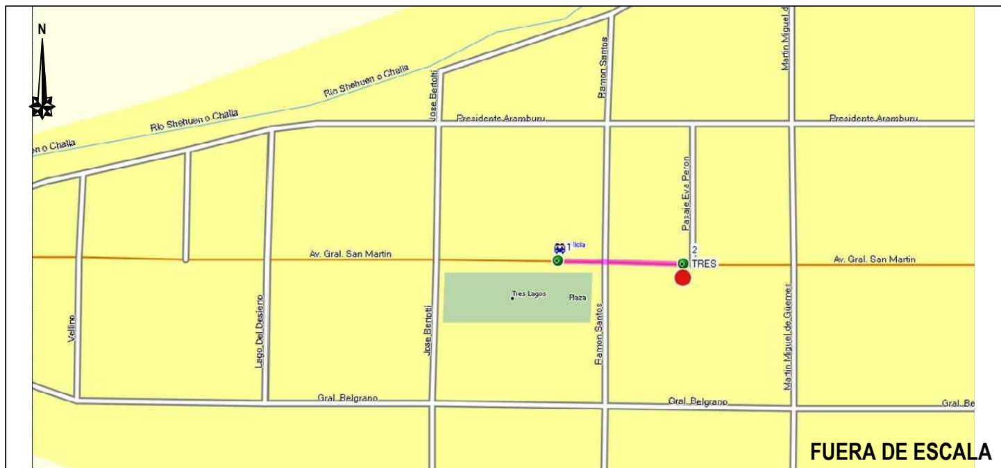
GRÁFICO DE ITINERARIO

Provincia: santa Cruz Departamento: El Calafate Lugar: Tres Lagos