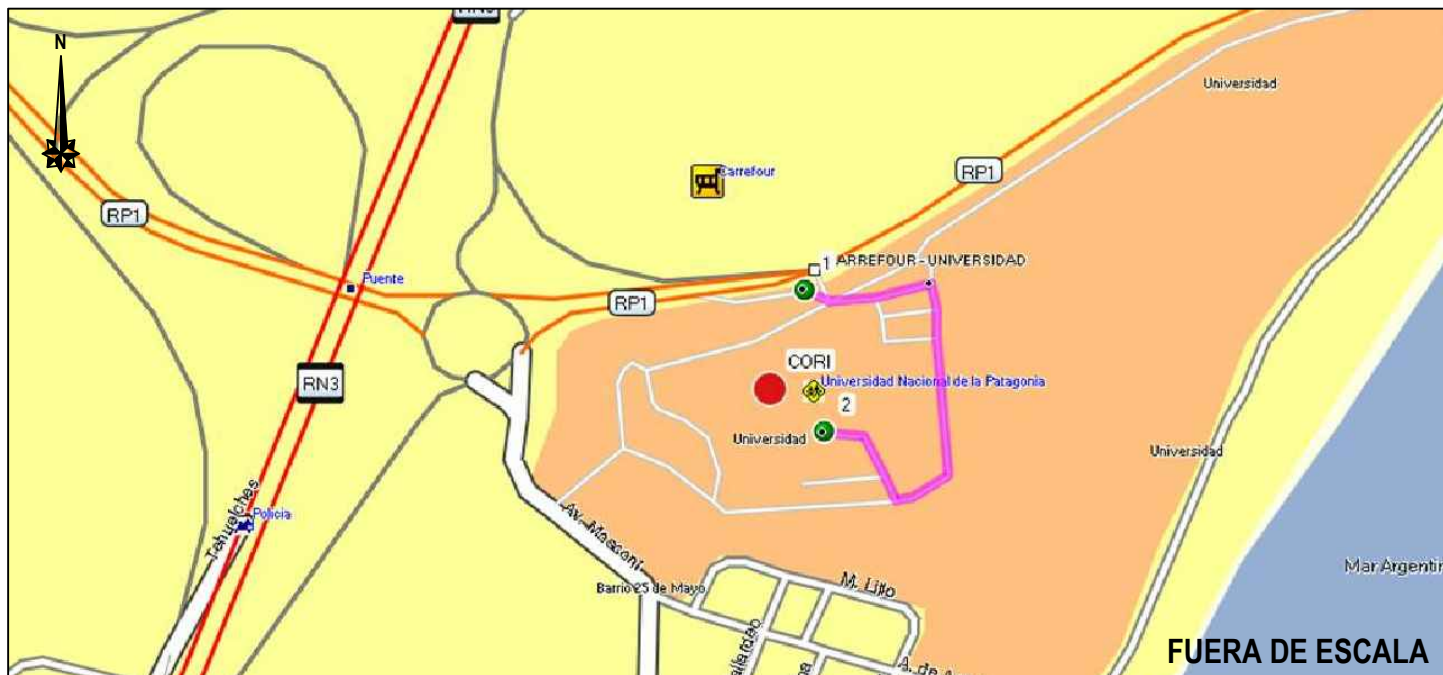
GRÁFICO DE ITINERARIO

Provincia: Chubut Departamento: Comodoro Rivadavia Lugar: Comodoro Rivadavia